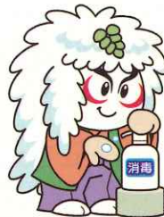
手指・物品の消毒