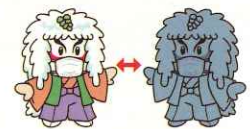
小坂町マスコットキャラクター 「かぶきん」