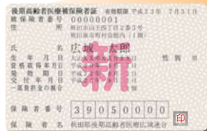
後期高齢者医療被保険者証（見本）

後期高齢者医療被保険者証 有効期限 平成23年 7月31日 被保険者番号 00000001 住 所 秋田市山王四丁目2番3号 秋田県市町村会館内（1階） 氏 名 広域 太郎 生 年 月 日 大正XX年XX月XX日 性別 男 資格取得年月日 平成20年4月1日 発効期日 平成22年8月1日 交付年月日 平成22年8月1日 一部負担金の割合 1割